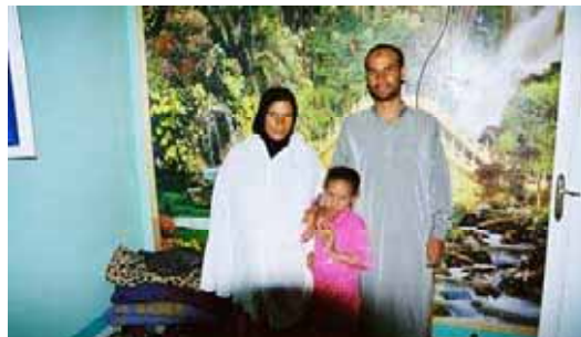
ASZH, SHAABAN & MEYSHA

21. 30 Uhr heißt es endgültig Abschied zu nehmen, nicht ohne vorher noch ein paar kleine Geschenke zu verteilen und ein Versprechen abzugeben.